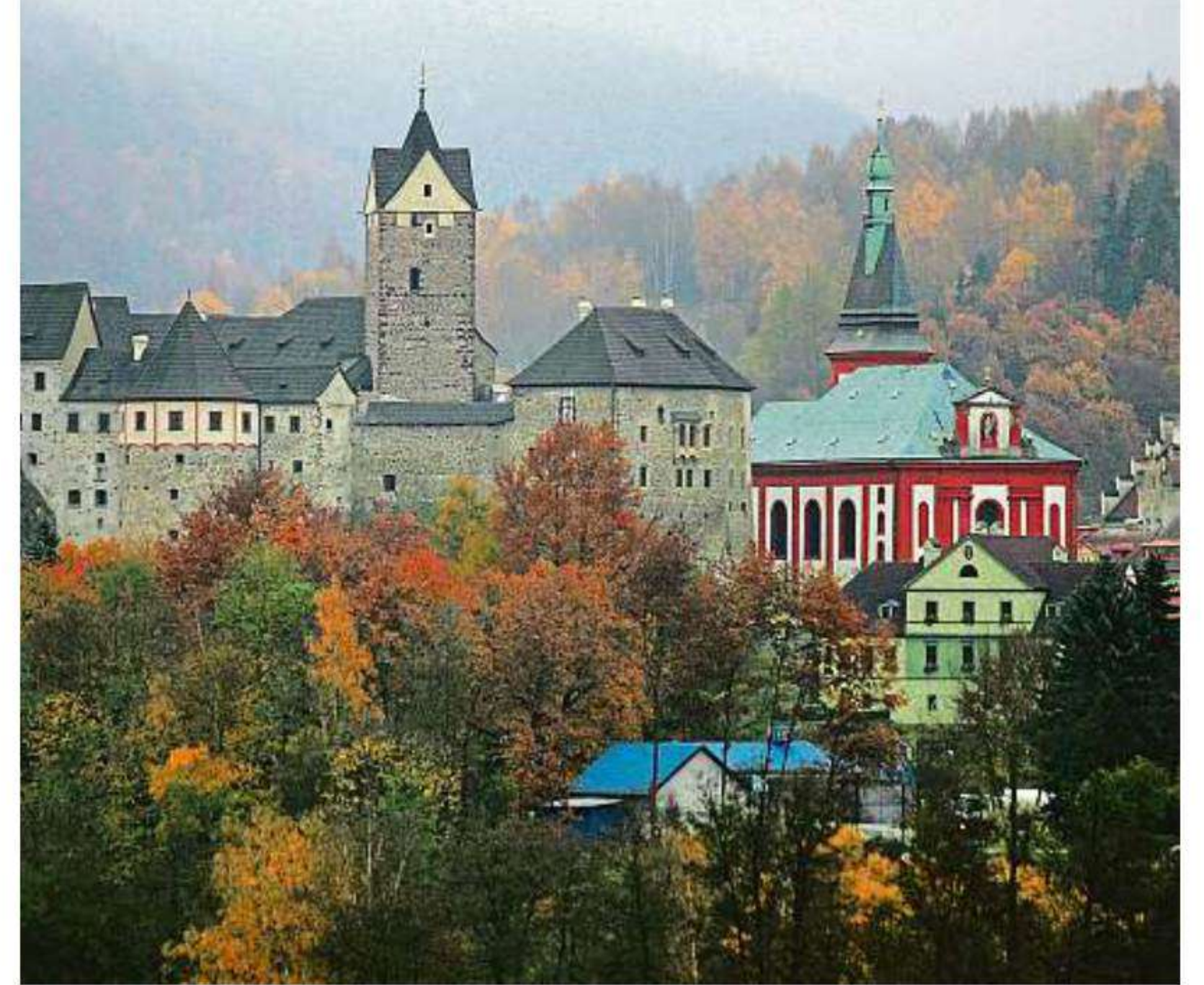
Loket Návštěvníků letos dorazilo zatím 110 tisíc. Další ještě přibudou, protože 14. listopadu se konají Svatomartinské slavnosti.